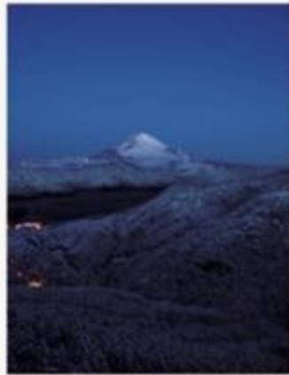
11月・12月 白雪富士 Sotetsu Fuji 神奈川・箱根