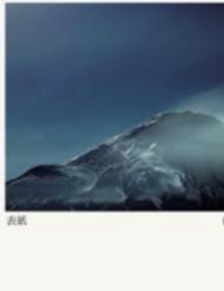
表紙 夜降 Yogenchi 静岡・御殿場