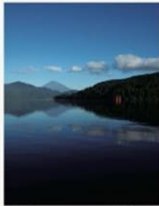
7月・8月 箱根富士・夏晴 Hakone Fuji Natsuke 神奈川・箱根