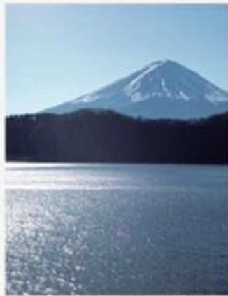
5月・6月 御開 Kiyuu 山梨・西郷