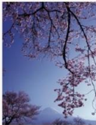
3月・4月 春違 Haruoi 静岡・富士宮