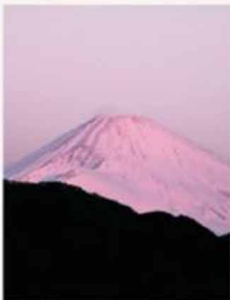
1月・2月 初春 Hatsuharu 神奈川・箱根