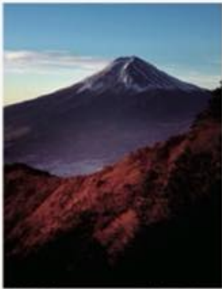
9月・10月 秋燃 Akimoyu 山梨・三ツ峠