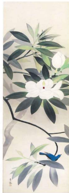
小林古径 「白花小禽」 昭和11年 (1936)