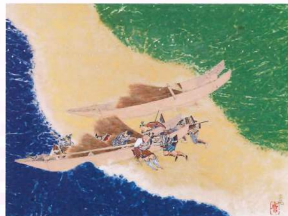
前田青邨 「真鶴之浜」 昭和44年 (1969)

横山大観の「霊峰一文字」(ちらし表面)は、縦約1m、長さ約9mという絹地に、湧き上がる黒雲から姿を現す霊峰富士の雄姿を描いた大作です。大正15年(1926)、人形浄瑠璃の舞台の引幕として使われて以来、ほとんど世に知られないまま秘蔵されていましたが、岡田美術館の所蔵となり、昨年秋の開館を機に展示されました。この度、新たに収蔵された速水御舟「木蓮(春園麗華)」も久々の公開となる作品です。御舟が初の個展に出品した一幅で、墨一色で暗紅紫色の花の色を想起させる表現力に驚かされます。開館一周年を記念する本展では、これら2点と併せ、大観・御舟がともに活動した日本美術院の画家たちの作品を一堂に展示します。橋本雅邦・菱田春草・下村観山・小茂田青樹・川合玉堂・小林古径・前田青邨・小倉遊亀ほか、明治から昭和にかけて日本画の近代化を先導した画家たちの、華やかで革新的な作品の数々をお楽しみいただければ幸いです。