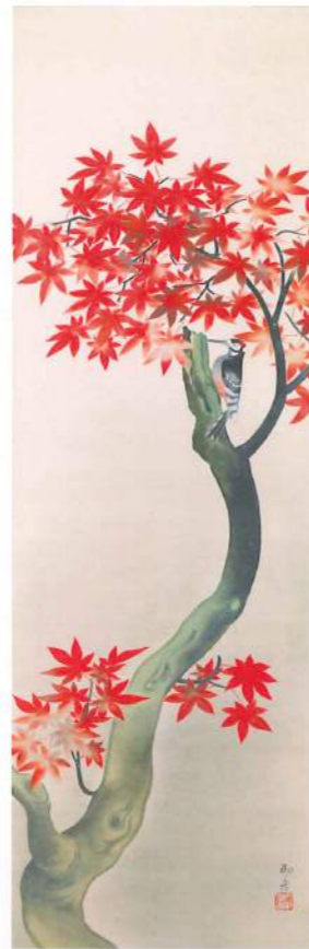
速水御舟 「紅葉」 昭和9年 (1934)