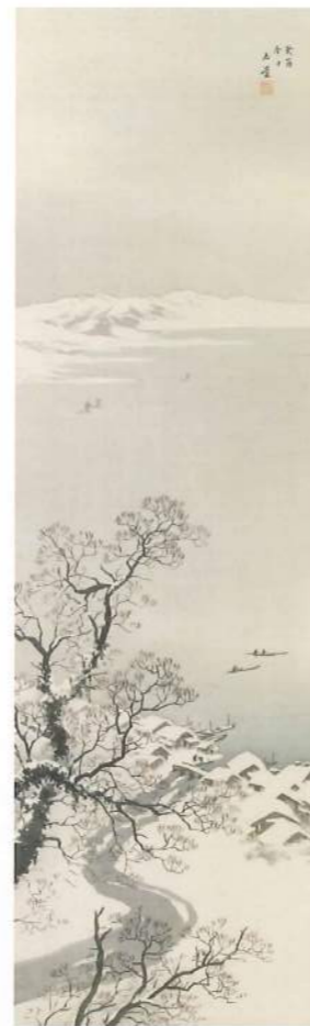
川合玉堂 「湖畔積雪」 昭和8年 (1933)