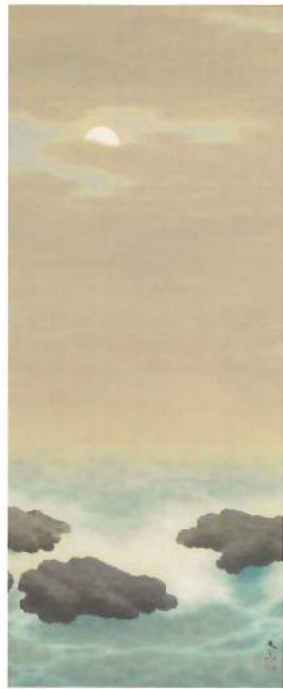
菱田春草 「海月」 明治後期