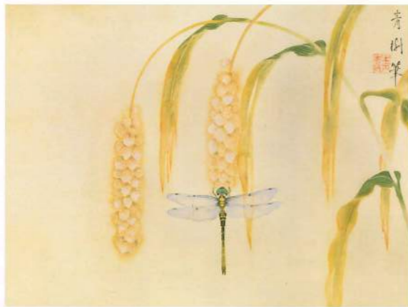
小茂田青樹 「粟に蜻蛉」 昭和初期