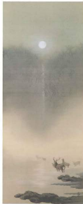
下村観山 「月下渡鹿」 明治後期