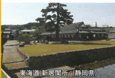
東海道 新居関所 (静岡県)