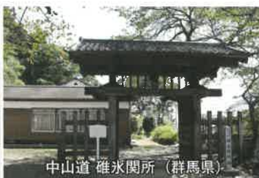
中山道 碓氷関所 (群馬県)