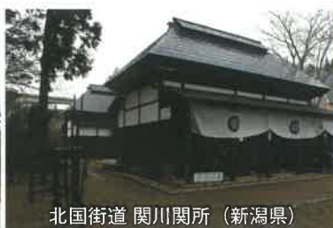
北国街道 関川関所 (新潟県)