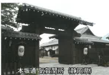
本坂道 気賀関所 (静岡県)